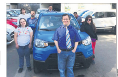
Además del auto hay cerca de 30 premios más.

Cada número vale $1.000. El sorteo es el 10 de mayo.